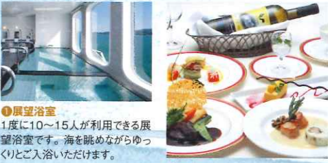
●展望浴室 1度に10~15人が利用できる展望浴室です。海を眺めながらゆっくりとご入浴いただけます。