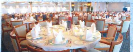
●メインダイニングルーム 「ばしふいっくびいなす」が誇るメインダイニング。旅のシーンに合わせ趣向を凝らしたフルコースディナーやスイーツなど、バラエティーに富み、健康にも配慮したこだわりのメニューがお楽しみいただけます。

クルーズという旅のステージには、地上とはまったく違う世界が広がっています。この素晴らしい時間を存分にお楽しみいただく為に、最高級のホテルの安らぎや、バラエティーに富んだ施設やイベントと、他にはない旅のスタイルをご用意しております。