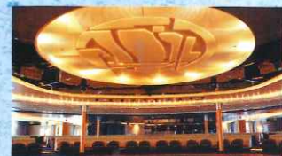
●メインラウンジ ダンスフロアを取り囲むようにゆったりと広く配置された客席。観る、楽しむ、語り合う様々なシーンで活躍する社交のひとときを演出します。